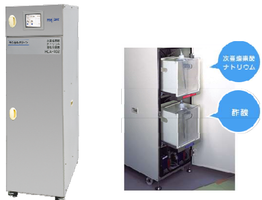
図2 次亜塩素酸ナトリウム活性化装置 外観・内部